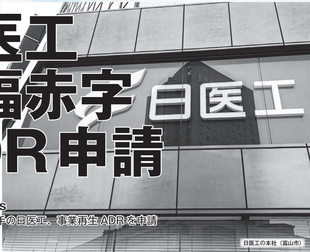
日医工の本社(富山市)