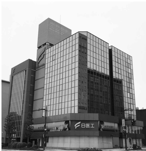
日医工の本社（富山市）

基本合意書を締結したのは、ジャパン・インダストリアル・ソリューションズ第参号投資事業有限責任組合（TSR企業コード：693795123、千代田区）。日医工に対して、最大200億円を出資する意向があるという。