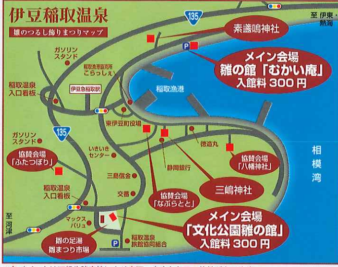
※各イベントは天候や諸事情により変更・中止となる可能性があります。