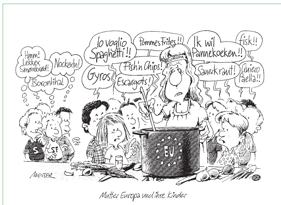
Das europäische Schlaraffenland

Es gibt eine schier unübersehbare, regalfüllende Menge von Materialien zu speziellen Themen, die von den diversen europäischen und nationalen Informationsagenturen herausgegeben werden. Diese Fülle leistet aber nur einen begrenzten Beitrag zur allgemeinen Aufklärung und nur einen geringen für die schulische Arbeit. Das Informa-