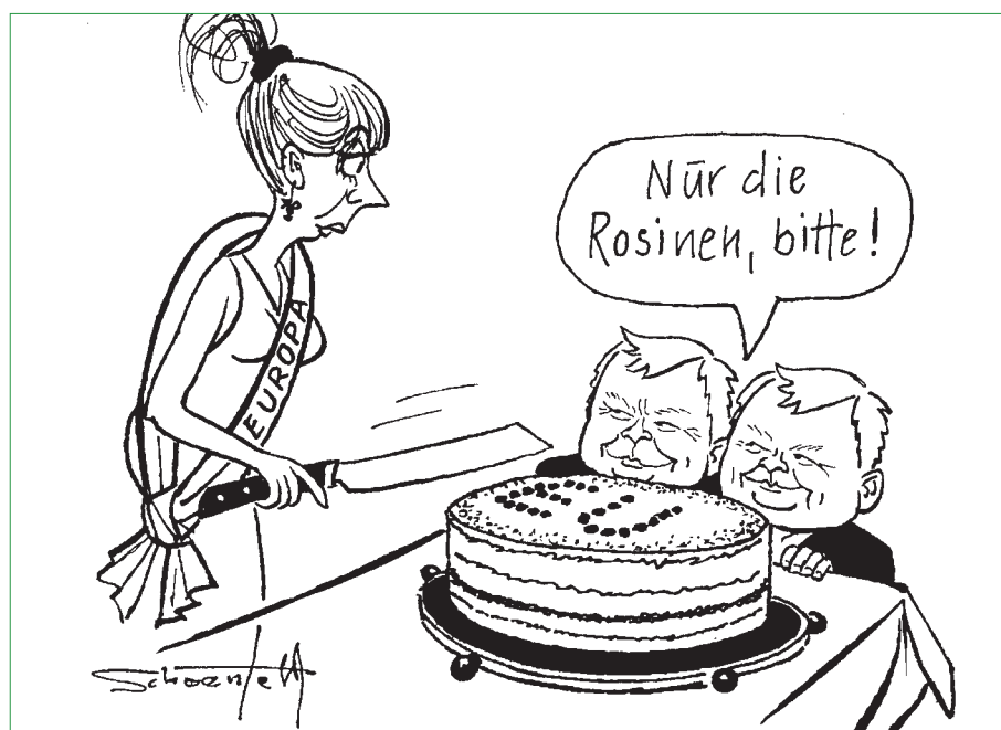
Mit den Kaczynski-Zwillingen am Tisch

und die Europäische Kommission, die gehalten sind, gemeinsame Interessen gegen die nationalen Sonderwünsche zu vertreten. Dieses komplexe Geflecht, überhaupt die Komplexität der europäischen Fragen zu erkennen und nicht von vornherein mit Vorurteilen abzulehnen, ist ein wichtiges Ziel des Unterrichts. Verständnis für die historische Leistung und Problembewusstsein gleichermaßen sollen erreicht werden.