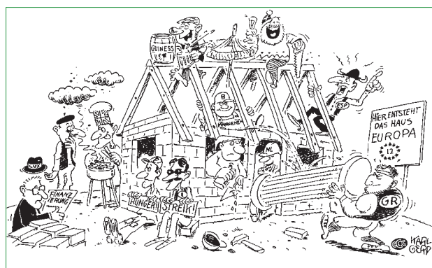
Hausbau – Das europäische Haus

Die supranationalen Strukturen der Europäischen Union sind einmalig in der Welt. Höchst Erstaunliches ist in den letzten 50 Jahren geleistet worden, wenn man den Hass und die Schrecken der beiden Weltkriege und den Terror der Diktaturen und die Not der Nachkriegszeiten in den 50 Jahren seit Beginn des 20. Jahrhunderts betrachtet. Vieles ist längst Wirklichkeit, was vor 50 Jahren als Utopie galt. Der europäische Einigungsprozess seither hat wesentlich zu Europas Friedensordnung, seiner Freiheit, der Mehrung seines Wohlstands und zur Überwindung der Teilung Europas beigetragen. Heute sind seine innere Sicherheit, der Schutz der Umwelt, der innere soziale Angleichungsprozess und das gemeinsame Anpacken globaler Herausforderungen nicht ohne eine Weiterentwicklung seiner Strukturen denkbar. Das vorliegende Unterrichtsmaterial soll auch deutlich machen, wie stolz die Europäer bei aller Kritik im Einzelnen auf diesen Einigungsprozess sein können, wie sehr europäische Lösungen vieler noch bestehender Probleme notwendig sind und welchen Mehrwert die europäische Einigung seinen Bürgern gebracht hat. Dabei sei auch auf die grundsätzliche Problemorientierung der didaktischen Anlage verwiesen. Viel ist in Europa noch zu tun, wie nicht anders zu erwarten ist. Einiges wird auch als Fehlentwicklung gesehen. Europa war immer eine Baustelle, und bei so