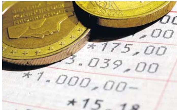
Wie viel kommt unter dem Strich bei einer Geldanlage heraus? Das lässt sich leicht berechnen.