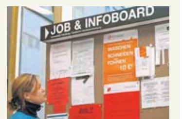
Wenn nach dem Abschluss nicht gleich ein Job in Sicht ist, kann sich auch ein Praktikum noch lohnen.