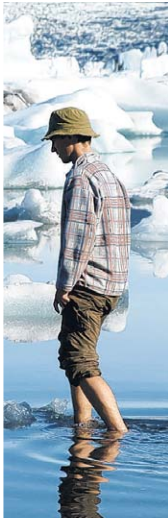
Eisbaden kann als Therapie bei Gelenkentzündungen eingesetzt werden.

Einsatzgebiete der Kryotherapie sind muskuloskeletale Störungen wie akute Wirbelsäulen- und Gelenksbeschwerden. Neben der Schmerzlinderung und Ödemprophylaxe nach Verletzungen, im Sinne von Zerrungen und Prellungen wird dieses Verfahren vielfach bei Überbeanspruchungen wie