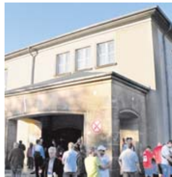
Vor dem Aus? Die Bruno-Gehrke-Halle an der Neuendorfer Straße.

SPANDAU. Gemeinsam Fußball zu gucken ist in den kommenden Wochen unter anderem auf der Zitadelle möglich. Dort können die Spiele im Rahmen eines Fußball-Familienfestes verfolgt werden. Ebenfalls zur Public-Viewing-Zone wird das Brauhaus Spandau, Neuendorfer Straße 1. Es bietet 350 Plätze im Lokal sowie 650 im Außenbereich. tf