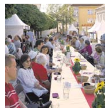
Gut besucht waren die langen Tafeln des Kreiskirchentags.

Das Gotische Haus in der Breiten Straße 32 wurde am Sonntagabend auch noch zum „Po-