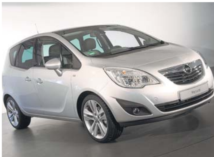
Der neue Opel Meriva setzt im Vergleich zu seinem Vorgängermodell in puncto Platz und Flexibilität noch eins drauf.

Wer Platz genommen hat, den erwartet Raum und Licht. In An-