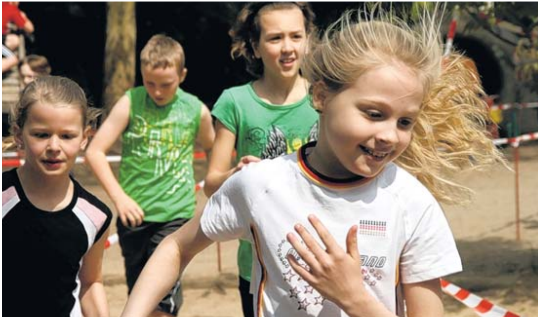
Schüler sorgten an der Immanuel-Schule mit flinken Füßen dafür, dass für dringend benötigtes Unterrichtsmaterial rund 2300 Euro erlaufen wurden.