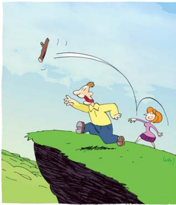
WIESO "NETTE MÄNNER" AUSGESTORBEN SIND. aus der Freiluftausstellung „Reizende Bilder – Cartoons von Frauen und Männern“ im Garten vom Kulturkaten in Prerow auf dem Darß. Zu sehen vom 11. Juni bis 12. September. Infos: www.cartoonair-am-meer.de

■ Ev. Johannesstift, Tagespflege Hanna, Schönwalder Allee 26: „Begutachtung für die Pflegeversicherung“, 14. Juni, 17.30 Uhr, Infos und Anmeldung unter ☎ 33 60 94 84