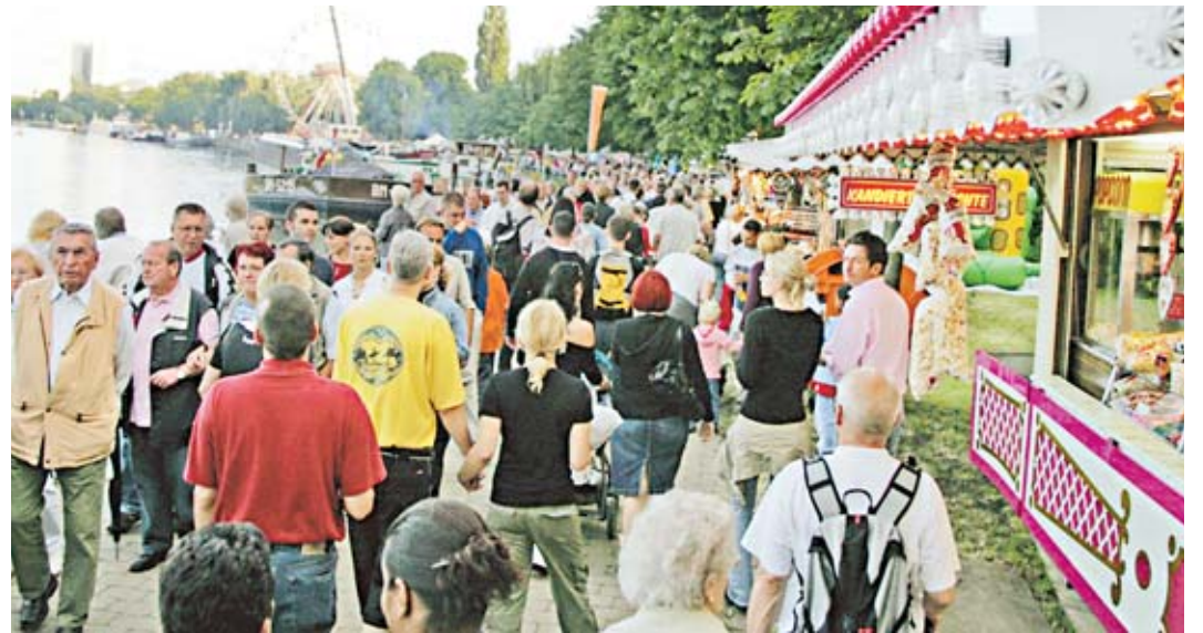
Das Havelufer wird am kommenden Wochenende wieder Ziel zahlreicher Besucher sein.

Wie in den vergangenen Jahren reihen sich von der Juliusturm- bis zur Dischinger Brücke Imbiss- und Verkaufsstände, Schausteller und Künstler mit ihren Angeboten aneinander. Kurzfristig konnte die Aktionsfläche für Kinder zwischen dem Parkplatz Stabholzgarten und dem Havelufer durch den Familiengarten des Deutschen Familienverbandes e.V. erweitert werden. Das seit vier Jahren existierende Projekt unter dem Motto „Kinder geben ihre Eltern ab“ macht während des Havelfestes zum ersten Mal in Spandau Station – am Freitag von 15 bis 20 Uhr sowie am Sonnabend und Sonntag von 11 bis 19 Uhr. Auf rund 500 Quadratmetern können Kinder bis zum zehnten Lebensjahr mit Playmais und selbst bemalten Autos spielen, Schmuck aus Steckperlen basteln, sich an Ge-