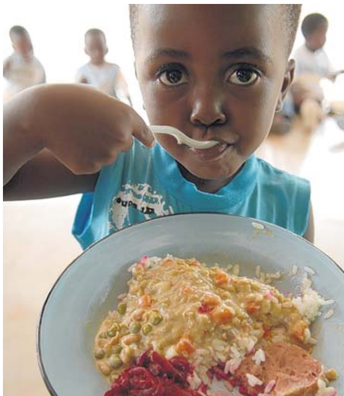
Gesundes Essen: Darauf wird in Elandsdoorn besonderen Wert gelegt.