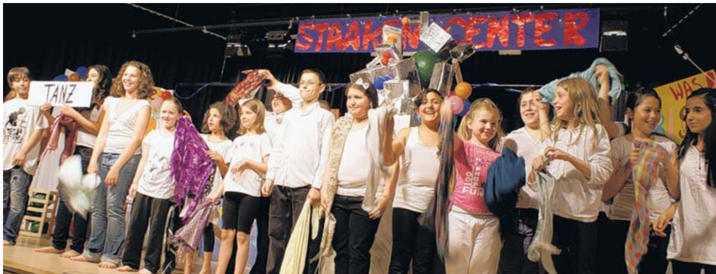
Die Tänzer der Inszenierung freuen sich über einen großen Beifall.

WESTEND. Bevor die Spiele der Fußballweltmeisterschaft auf der Fanmeile am 17. Juni öffentlich gezeigt werden, können die Eröffnungsfeier und die ersten Spiele der Gruppenphase vom 11. bis 18. Juni auf dem Olympischen Platz vor dem Olympiastadion gesehen werden. Danach finden wegen des Umzugs bis zum 23. Juni keine Übertragungen auf einer berlinweiten Fanmeile statt, weil die Fanmeile umzieht und zwischen der Siegestsäule und dem Brandenburger Tor erneut aufgebaut wird. Auf dem Olympischen Platz ist die Fanmeile im genannten Zeitraum täglich von 12 bis 23 Uhr geöffnet. Für 200 000 Besucher wird ein Festprogramm geplant. Dieses soll demnächst auf www.berlinfifanfest.com zu finden sein.