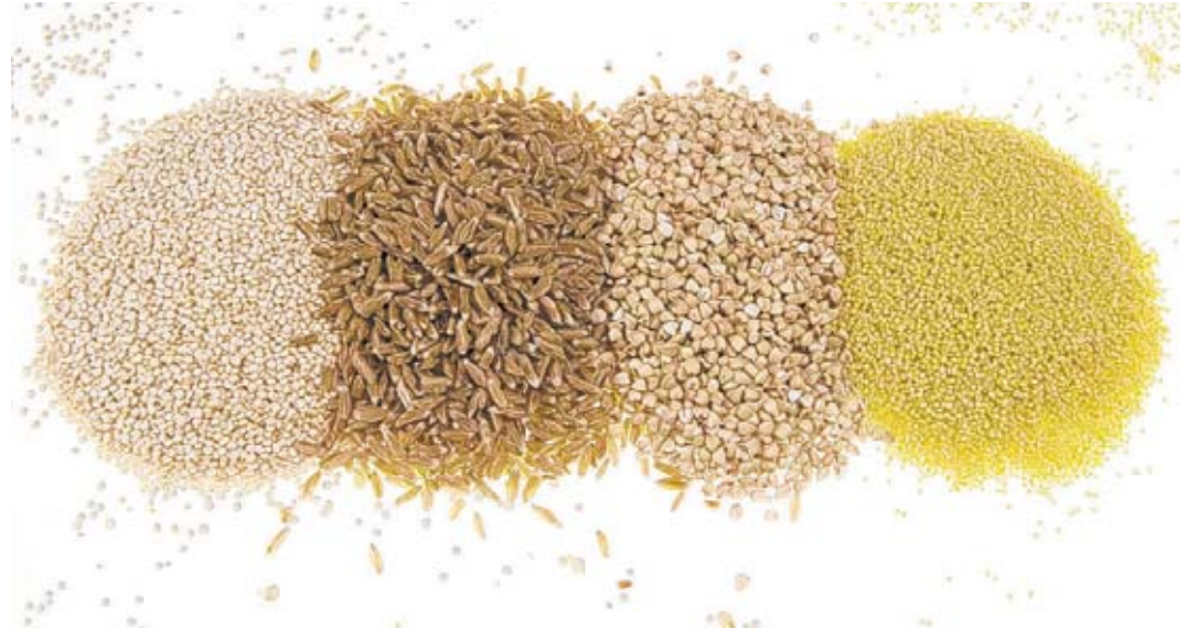
Quinoa, Grünkern, Buchweizen und Hirse sind vielseitig in der modernen Küche einsetzbar.