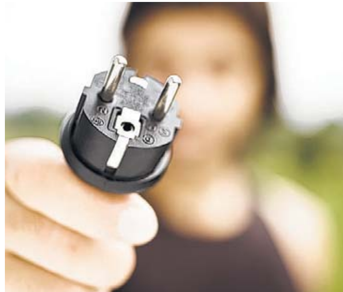
Meiden Sie Verteiler und lange Leitungen: Schließen Sie Geräte möglichst immer direkt an die Steckdose an.

Schutzschalter – bessere Prävention vor Stromschlägen