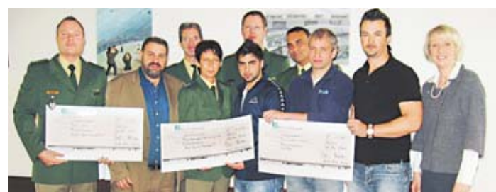
1000 Euro gab es für die erfolgreiche Zusammenarbeit.