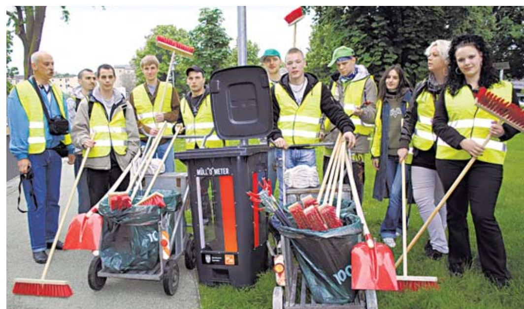
Mit Besen und Greifern sind die Jugendlichen am Lindenufer dem Müll auf der Spur. Alles, was sie auf sammeln, landet im Müll-O-Meter. Es soll die tägliche Vermüllung des Lindenufers verdeutlichen.

SPANDAU. Am Lindenufer hat jetzt ein Pilotprojekt begonnen. Ein sogenanntes Müll-O-Meter steht seit kurzem auf der Planiermeile. Der Bezirk und die Berliner Stadtreinigungsbetriebe (BSR) wollen damit gegen die zunehmende Verschmutzung der Grünanlage vorgehen.