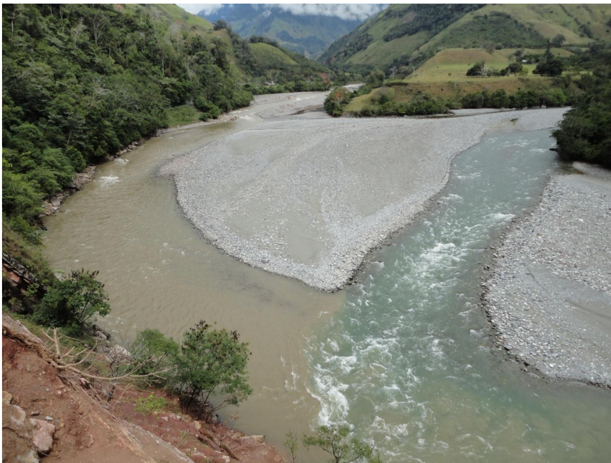
Foto 6: Confluencia de los ríos Huancabamba y Santa Cruz para dar origen al río Pozuzo