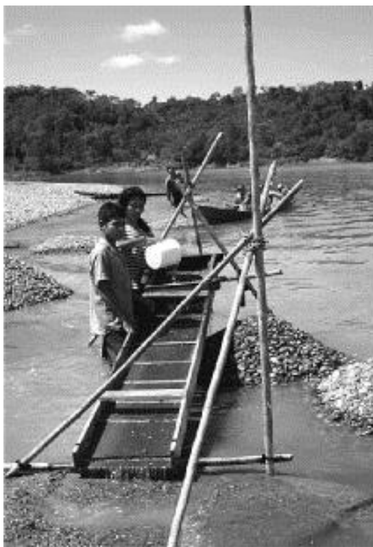
Foto 17: Minería artesanal en el río Pachitea

zona para comprobar si viene trabajando según las especificaciones técnicas medio ambientales (Alvares, C.; Zegarra, C., Sandoval, D.; comunicacion personal)