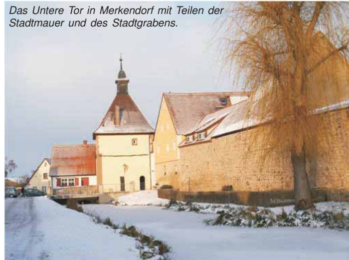
Das Untere Tor in Merkendorf mit Teilen der Stadtmauer und des Stadtgrabens.