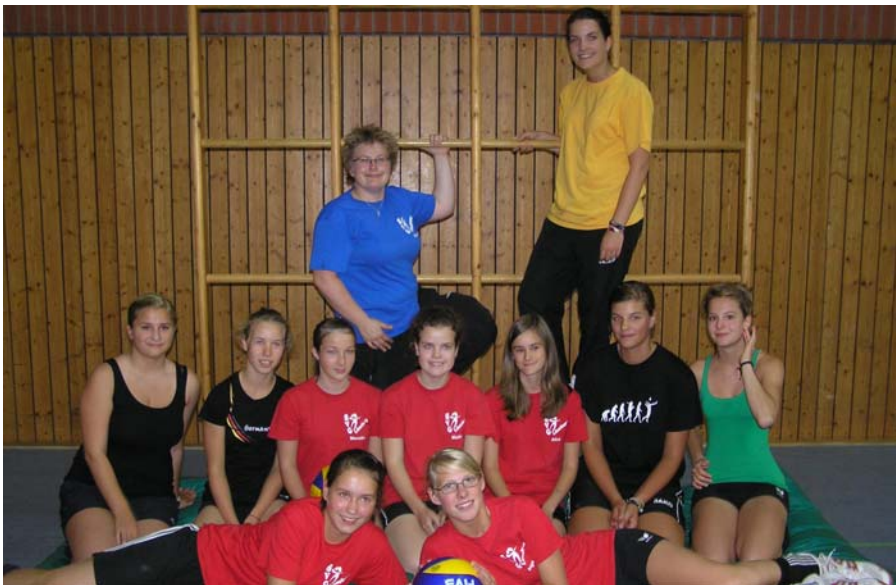
weibliche U16 und U18