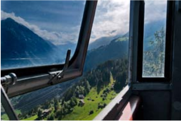
Blick ins Reusstal.