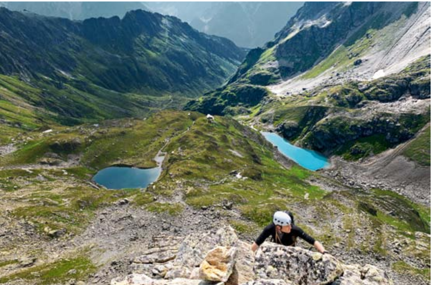
Weit unten der Nidersee, der Obersee und die Leutschachhütte.

Von einer «puren Genussklettere in gutem Fels» am Mäntliser ist auf der Website www.alpineklassikeruri.ch zu lesen. Auch der Clubführer Urner Alpen 3 des SAC erwähnt den Mäntliser als «Hüttenberg der Leutschachhütte» und nennt die Route über die SE-Kante eine «schöne Kletterei».