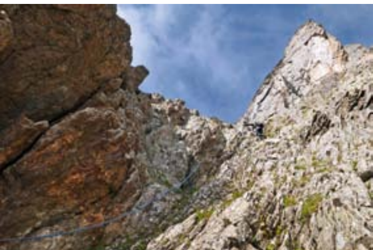
Die brüchige Rinne führt zum Einstieg in die Route. Helmtragen ist hier obligatorisch.

Dann wieder gleitet der Blick über den rötlich-grauen Gneis, sucht nach silbernen Plättchen, rostroten Schlaghaken oder einem Riss für einen Friend. Es folgt leichtes Stufengelände und wieder ein Stand; bis man schliesslich auf der obersten Spitze des Gneiszackens steht. Auf dem Gipfel des heimlichen, ja fast unbekanntenen Königs des Leitschachtals. Man verzeiht ihm gerne, dass sich seine Rückseite etwas weniger majestätisch zeigt und der Abstieg über eine schuttig-grasige Flanke und über Geröllhalden führt.