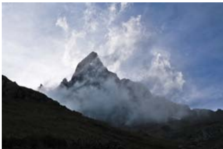
Der Mäntliser im hintersten Leitschachtal.