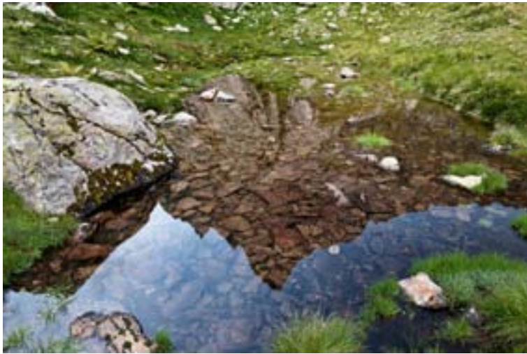
Der Mäntliser spiegelt sich im klaren Wasser eines Seeleins.

Im hintersten Leitschachtal im Kanton Uri ragt der Mäntliser still in den Himmel. Ein felsiger Zacken, der meist unbeachtet bleibt. Zu Unrecht, wie sich auf einer Klettertour zeigt: Seine Wandfluchten bieten alpine Klettereien in bestem Gneis.