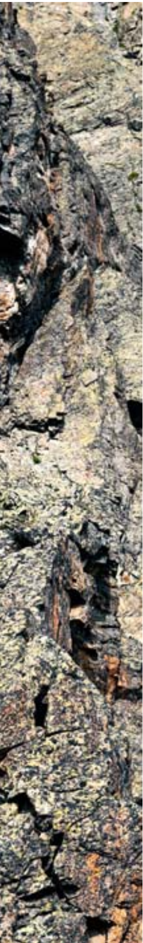
Bester Gneis in der Route an der Südostkante.