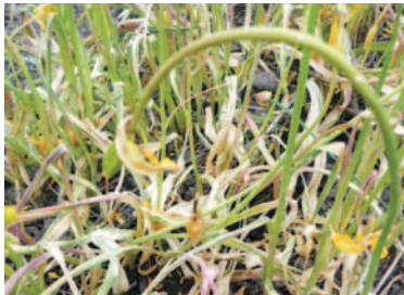
MIT HERBIZID BEHANDELT