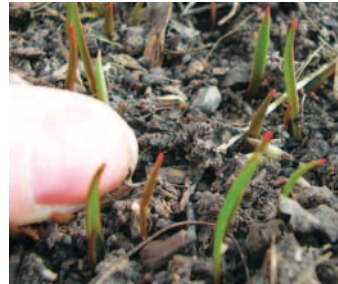
JUNGTULPEN IM 2. JAHR