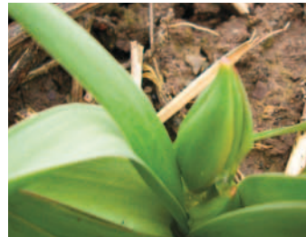
DER STÄNGEL BEGINNT SICH ZU STRECKEN