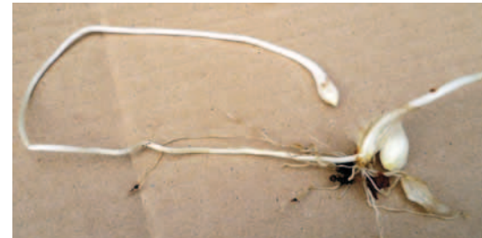
MUTTERZWIEBEL MIT AUSLÄUFER UND TOCHTERZWIEBEL

Vielen Zwiebelgewächsen gelingt es, ihre Zwiebel in der richtigen Tiefe zu platzieren, indem Tochterzwiebeln am Ende eines Ausläufers gebildet werden. Hierdurch ist die Tulpe in der Lage, z. B. wenn der Weinberg zur Neuanlage tief bearbeitet wurde, wieder in eine für sie optimale Bodentiefe zu gelangen. Eine Besonderheit der Wilden Tulpe ist es, dass nichtblühende Exemplare, die eine Mindestgröße der Zwiebel nicht unterschreiten, in der Lage sind, Tochterzwiebeln über Ausläufer in einiger Entfernung der Mutterzwiebel zu platzieren.