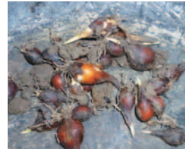
TULPEN NACH SAMMELN (SCHON AM SCHIEBEN)

Bereits im nächsten Frühjahr wachsen die Tulpen am neuen Standort. Waren die Zwiebeln groß und gut entwickelt, kann es auch sofort zur Blütenbildung kommen. In jedem Fall wird ein Laubblatt gebildet. Beachtet man die Maßnahmen der tulpenschonenden Bewirtschaftung, wird sich der Tulpenhorst bald zu einem prächtigen Bestand ausbreiten.