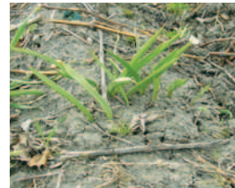
ÜBERTRAGUNG IM FOLGE- JAHR, NOCH OHNE BLÜTE