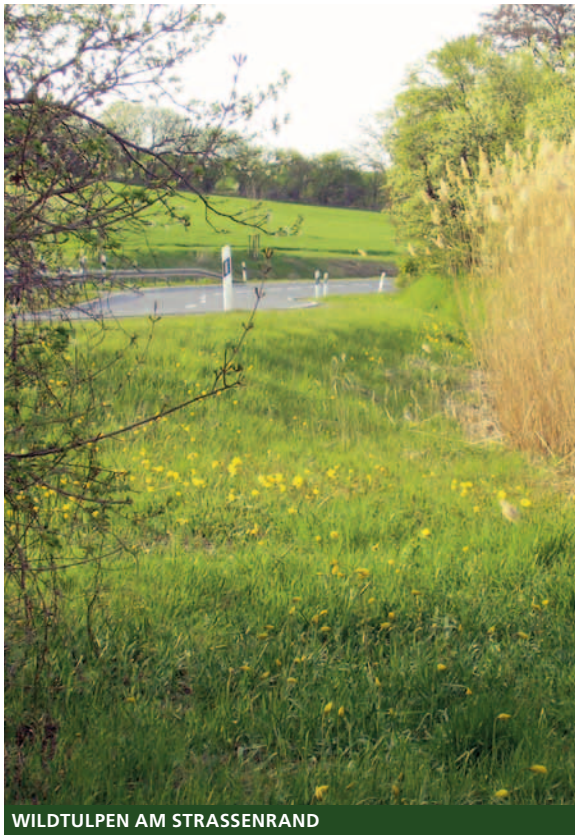
WILDTULPEN AM STRASSEN RAND