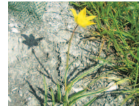
ERSTE BLÜTE IM JAHR NACH ÜBERSIEDLUNG