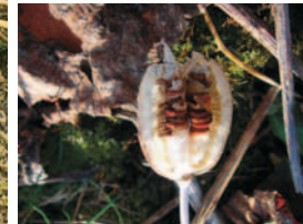
SAMENKAPSEL MIT SAMENPAKETEN