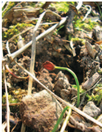
KEIMLINGSSPROSS AUS SAMEN WACHSEND