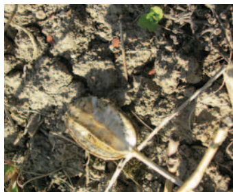
TULPENSAMEN NEBEN SAMENKAPSEL