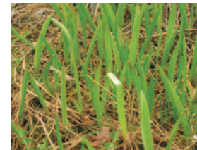
TULPEN, MEHRERE JAHRE NACH ÜBERSIEDLUNG