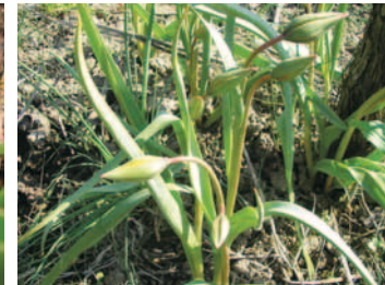
DIE BLÜTE STEHT BEVOR