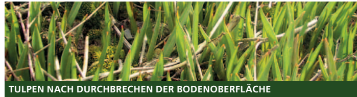
TULPEN NACH DURCHBRECHEN DER BODENOBERFLÄCHE

Dieses erste Blatt erreicht eine Länge von bis zu 10 cm und an der breitesten Stelle misst es bis zu einem Zentimeter. Bis die erste Blüte gebildet werden kann, vergehen mehrere Jahre (ca. 5). Die Bedingung für eine Blütenbildung ist eine kräftige Zwiebel. Bereits im Herbst erwacht die Tulpenzwiebel zu neuem Leben. Zunächst werden frische Wurzeln getrieben, und der Spross spitzt schon aus der Zwiebelhülle. Mit zunehmender Wärme im Spätwinter/ Frühlung erscheinen die Tulpen über der Erde. Bald lässt sich der Blütenansatz erkennen. Tulpen mit mehreren Blättern tragen fast immer auch eine Blütenknospe.