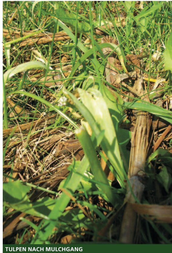
TULPEN NACH MULCHGANG