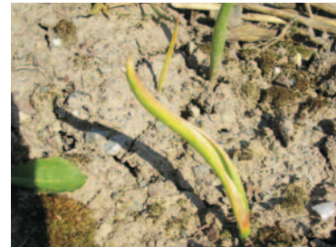
HERBIZIDSCHADEN IM FOLGEJAHR