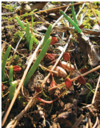
KEIMENDE SAMEN NEBEN MILCHSTERNEN