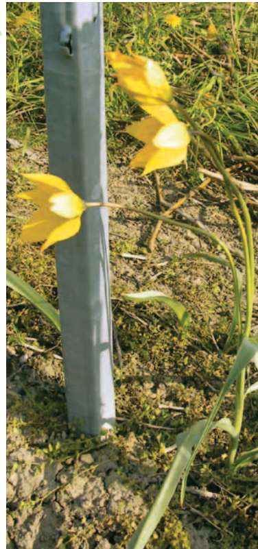
DREI BLÜTEN AN EINEM STÄNGEL

Die Blütenhüllblätter sind je zur Hälfte zu zwei Kreisen angeordnet. Die Blütenhüllblätter des äußeren Kreises sind 35 bis 63 mm lang und 8 bis 18 mm breit, spitz elliptisch und am Grunde kahl, die des inneren Kreises mit 35 bis 70 mm Länge und 16 bis 26 mm Breite etwas größer, eiförmig-lanzettlich und am Grunde bewimpert. Die Staubblätter sind ungefähr ein Drittel so lang wie die Blütenblätter und am Grunde dicht behaart. Die Staubfäden sind bärtig bewimpert und 9 bis 14 mm lang, die auffallend orangefarbenen Staubbeutel 4 bis 9 mm lang. Der hellgrüne, oberständige Fruchtknoten ist etwa 10 bis 12 mm lang und besteht aus drei verwachsenen Fruchtblättern. Kleine, gelbliche Narbenlappen schließen den Fruchtknoten ab. Die flachen Samen reifen in einer ledrigen, kugelig zur Spitze hin länglich ellipsoiden Fruchtkapsel von ungefähr 3 cm Länge.