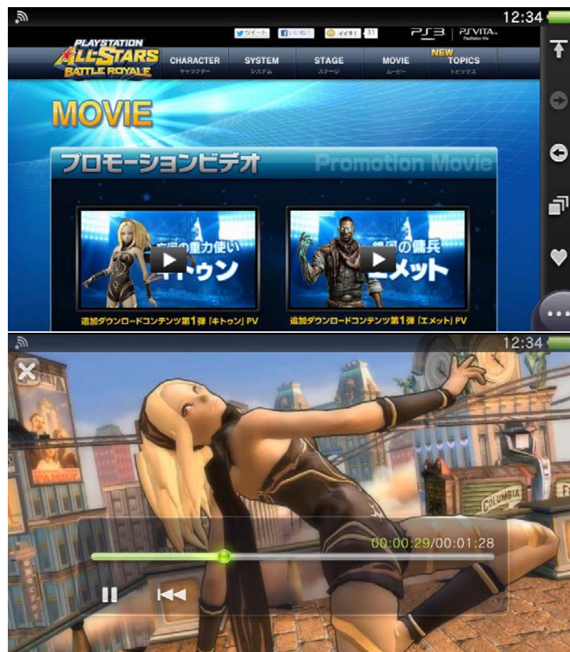
ブラウザーからの動画再生