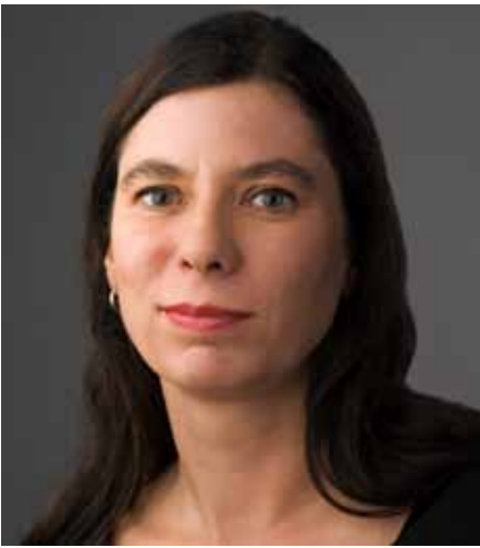
Sandra Scheeres Senatorin für Bildung, Jugend und Wissenschaft