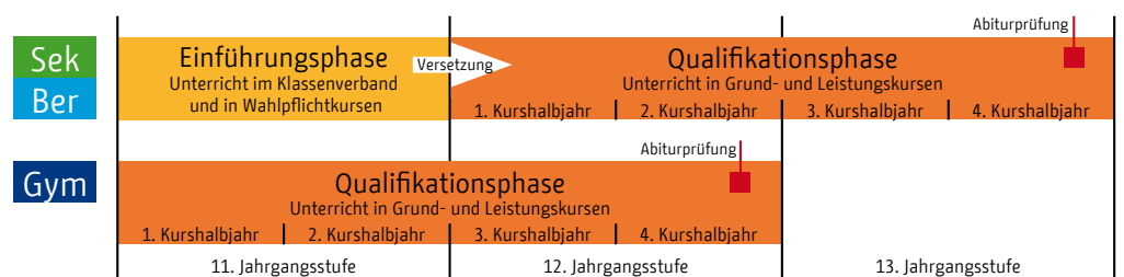
Abhängig von der Schulart dauert die gymnasiale Oberstufe zwei oder drei Jahre.

Für Bildungsgänge an Schulen besonderer pädagogischer Prägung müssen mitunter zusätzliche Regelungen beachten, so beispielsweise an der Eliteschule des Sports und für die Züge im mathematisch-naturwissenschaftlichen Netzwerk.