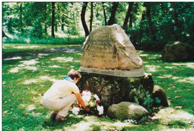
Niederlegung Blumengebinde am Gefallenendenkmal Rusendorf