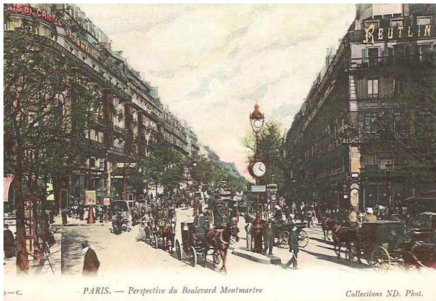
Estudio Reutlinger en el Boulevard Montmartre. Paris. 1890

Uno de estos mecanismos de diferenciación social empezaba a ser la fotografía, la que solo estaba al alcance de los ricos por su alto costo (grandes formatos, no se podían hacer copias). Con los nuevos adelantos que se introducen en la década de los 60' se logra reducir el gran formato creándose "las tarjeta de visita" o "vist card" (6x9 aprox.) Reemplazándose la placa metálica por el negativo de vidrio y reduciendo a una quinta parte el precio habitual de la fotografía, por lo cual los