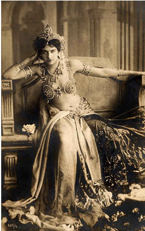
Mata-Hari. Bailarina, streptisera y espía

La fama y la fortuna lo acompañó en su carrera artística hasta que en 1930 destapando una botella de champagne en una de sus tantas celebraciones pierde un ojo al ser impactado con el corcho, este accidente forzó su retiro, terminando con ello el reinado de los Estudios de Reutlinger. Leopold muere el 16 de marzo de 1937 a la edad de 74 años.