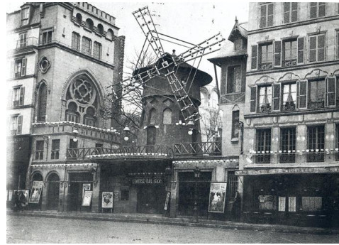
Moulin Rouge. Paris