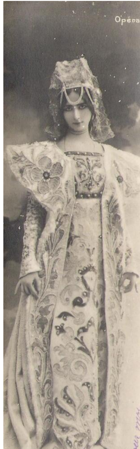
Cleo de Mérode. Bailarina de origen aristocrático