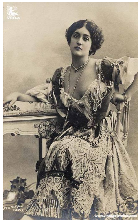
Lina Cavalieri, cantante de ópera

El estudio fue muy exitoso y su prestigio se fue acrecentando con el tiempo, artistas de la talla de Mata-Hari, bailarina streptisera, Cleo de Mérode bailarina de origen aristocrático y amante del rey Leopold de Bélgica, La bella Otero amante famosa y bailarina de danza flamenca, una de las mujeres mas ricas de Europa, Lina Cavalieri cantante de ópera quien llevó a cantar a su elenco al chalaco Alejandro Granda, Sara Bernhardt primera actriz empresaria del mundo quien actuara en el teatro Municipal del Callao, en una breve temporada en su gira por América, todas ellas serán retratadas por Reutlinger.