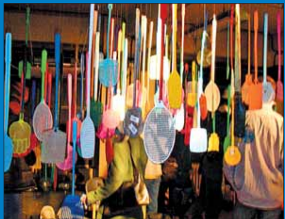
Trzysta pacek na muchy w jednym miejscu. To właśnie Projekt Praga!