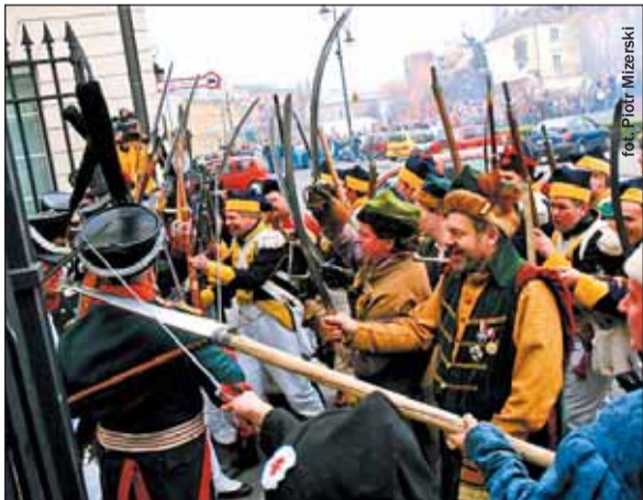
Warszawiacy coraz chętniej przypominają sobie o historii. Tłumy podziwiały walkę wojsk podczas inscenizacji insurekcji kościuszkowskiej

Coraz więcej ludzi przyjeżdża oglądać rekonstrukcje bitew w Modlinie, zaś ostatnia inscenizacja insurekcji kościuszkowskiej w stolicy przyciągnęła na ulice prawdziwe tłumy! Co więcej, by zobaczyć te niezwykle kosztowne inscenizacje, do Warszawy przyjeżdżają setki turystów z zagranicy!