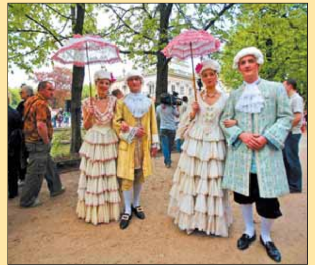
Alejkami w Łazienkach przechadzali się dworzanie z pięknymi dworkami