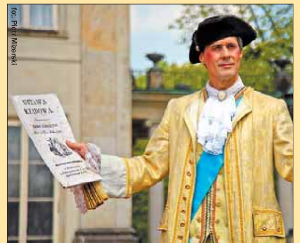
Na scenie przy Pałacu na Wyspie król Stanisław Poniatowski odczytał preambułę do Konstytucji 3 maja