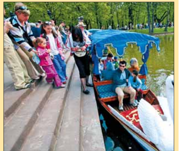
Trzeciego maja Łazienki powróciły do XVIII wieku. Warszawiacy mogli popływać wspaniałymi godolami i przejechać się dawnymi dorożkami. Atrakcji było mnóstwo!