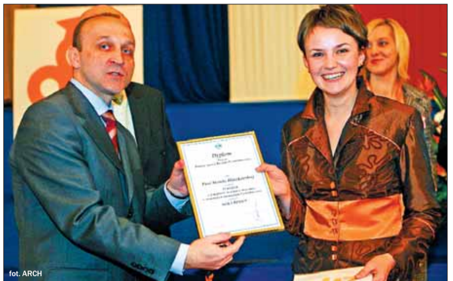
Działalność młodych biznesmenów została dostrzeżona nawet przez premiera Kazimierza Marcinkiewicza, który patronuje konkursom Akademickich Inkubatorów Przedsiębiorczości. Na zdjęciu premier i Monika Błaszowska, odbierająca dyplom za drugie miejsce w konkursie na najlepszy biznesplan

Plan jest prosty – promować młode firmy wśród przedsiębiorców i społeczeństwa. Działania są szybkie i konkretne. Już w maju rusza konkurs na Najlepszą Młodą Firmę w AIP – Ty-