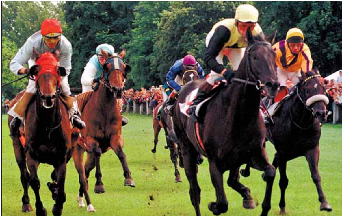
Przyszłość wyścigów konnych na Służewcu zależy dziś już tylko od tego, czy zdarzy się cud

Służewiecki tor wyścigów konnych kolejny rok z rzędu nie zacznie sezonu w terminie. Zapaść finansowa i brak jakiegokolwiek koncepcji rozwoju dobijają giganta. Czy to koniec wielkiej tradycji?