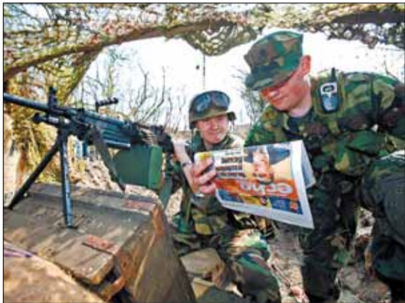
Gdy w Twierdzy Modlin wojsko walczyło na śmierć i życie nie mogło zabraknąć „Echa Miasta”!