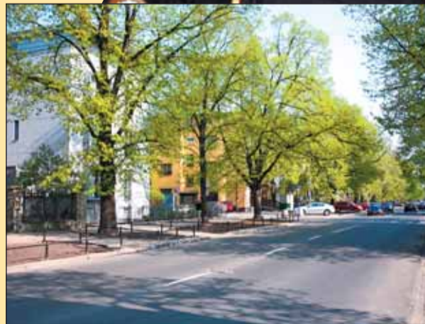
Cała ulica Francuska na Saskiej Kępie zamieni się w wielką kawiarnię na cześć Agnieszki Osieckiej