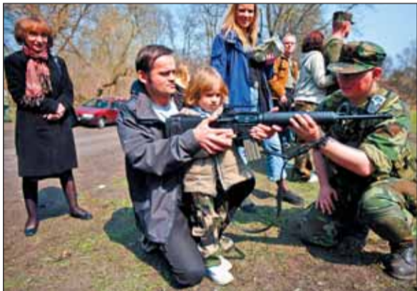
Zainteresowanie imprezami jest ogromne. Przychodzą na nie całe rodziny