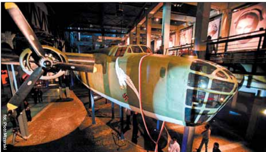
Największe zainteresowanie zwiedzających wzbudził samolot Liberator