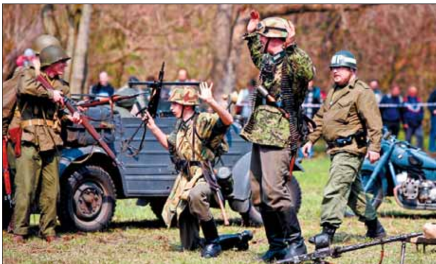
Podczas rekonstrukcji każdy ma broń, którą wypożycza się z łódzkiej Filmówki