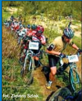
fol. Zieleny Szlak