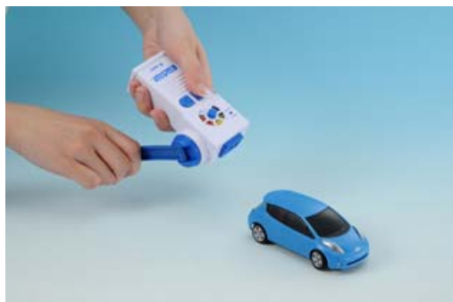
実写をモチーフにした 「EDASH」(01 NISSAN LEAF)