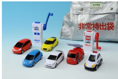
左4車種: 小学生向け「EDASH」