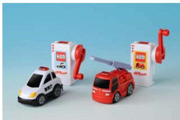
「ぐるぐるドライブ」(全4種/各4179円)

左から「01 NISSAN LEAF」、「02 Toyota PRIUS」 「03 Honda CR-Z」、「04 Honda FIT HYBRID」