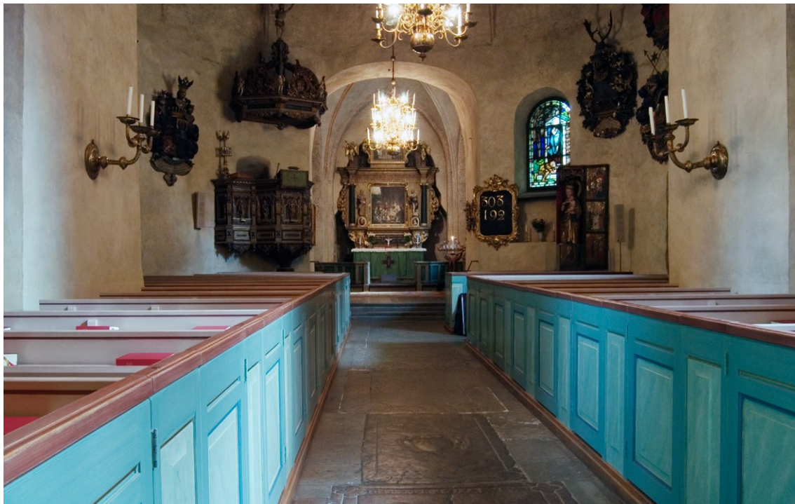
Interiör mot öster.

Predikstolen är snidad i trä med ursprunglig polykromi i gråvitt, rött, blått och guld, framtagen 1928. I korgens nischer står statyetter som föreställer Kristus och de fyra evangelisterna . Ljudtaket, som kröns av Kristus med segerfana , bär de la Gardies, Pfalz', Gyllenhielms och Ribbings vapen samt inskriften "Anno 1674". Predikstolen är skänkt av Magnus Gabriel de la Gardie och möjligen utförd av bildhuggaren