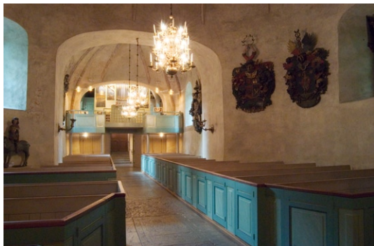
Interiör mot väster.

Genom glasade, svängdörrar kommer man in i kyrkorummets långhus med mittgång av kalksten och numera sex stycken infällda gravhällar. Några flyttades till koret 1928. Till de ovanligare hör en gravhäll av kalksten från