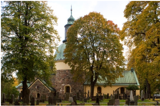
Exteriör från norr.

putslisten vid takfot på samtliga byggnadskroppar. Vapenhusets gavelröste liksom portalens omfattning och de tillbyggda gravkorens fasader är murade i tegel. Samtliga valv är slagna av tegel.