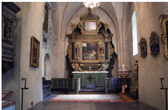
Interiör mot koret i öster.

Koret domineras av den altaruppsats som utfördes 1666 av bildhuggare Hans Jerling och bestodades av rikskanslern Magnus Gabriel de la Gardie. Från den tiden är även Karl X:s och Hedvig Eleonoras vapen, som tidigare markerade de två främsta, kungliga bänkarna, men nu hänger på södra muren i triumfbågen . Altaruppsatsen är snidad i trä och ramar in två målningar i olja på träpannå av nederländskt ursprung. Den övre tavlan framställer Marias kyrkogång och den undre återger herdarnas tillbedjan. Altaruppsatsen kröns av en i trä snidad madonna, daterad till 1500-talets senare del. Altarbordet