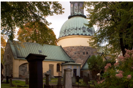
Exteriör från söder.

Kyrkans gråstensmurar med utstrukna fogar är oputsade och saknar sockel. Påbyggda tegelmurar är slätputsade och avfärgade i gult, senast vid renovering 2000. Tegelmurning i västgavels röste är slammat i ton som överensstämmer med muren i övrigt. Putsade partier på långhus och gravkor har låg gråstenssockel. Samtliga