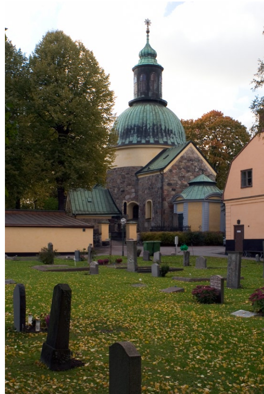
Exteriör från öster.

fönsternischer är slätputsade och avfärgade i brunockra och fönstersnickerierna är målade i ekimiterande färg, senast 2000. Samtliga tak är täckta med kopparplåt.