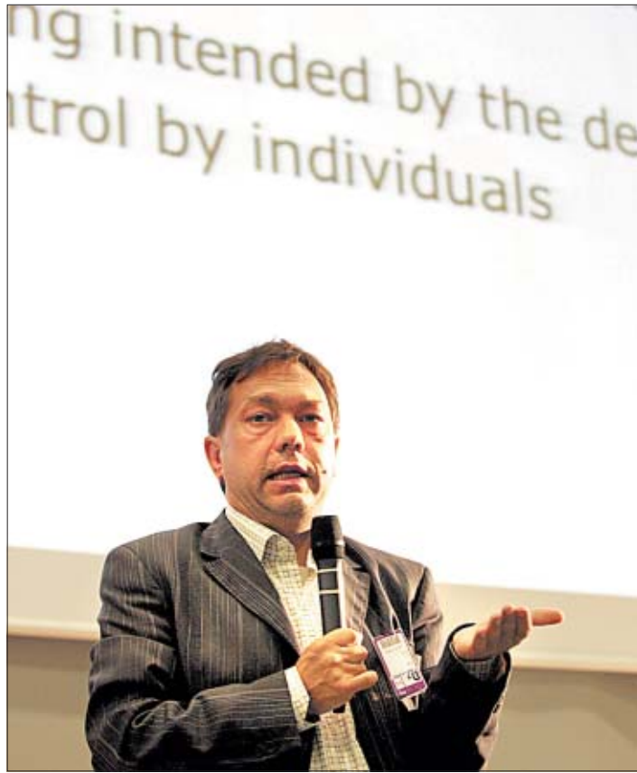
Luc Steels, en Barcelona.

R. Sus creadores hemos sido más de 50 personas, el equipo de Tokio se encargó de la estructura del robot, mientras que nosotros, en París, estudiamos su interacción con el entorno. El resultado es un humanoide de unos 50 centímetros de altura, que puede caminar de manera totalmente autónoma: se balan-