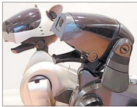
Versiónes felina, al fondo, y canina de Aibo. J. M.

cea, se adapta a los desniveles del terreno, sube y baja escaleras, se levanta solo si se cae, camina lateralmente... No es muy rápido, pero puede hacer movimientos muy precisos. Está dotado de dos cámaras, con las que distingue los obstáculos, lo que le permite diseñar un itinerario para evitarlos. También memori-