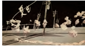
3. © ソニー・ミュージックアソシエイテッドレコーズ