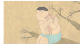
4. © 和田洋 / 東京藝術大学