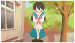
1. © 石田 祐康

国内の美術館や、アートフェスティバル、アニメーション映画祭、ゲームショウ等で、第14回文化庁メディア芸術祭の優秀な映像作品を上映します。アート、アニメーション、エンターテインメントの各部門から選ばれた、新しい視覚体験や表現の幅の広がりを感じる作品をお届けします。