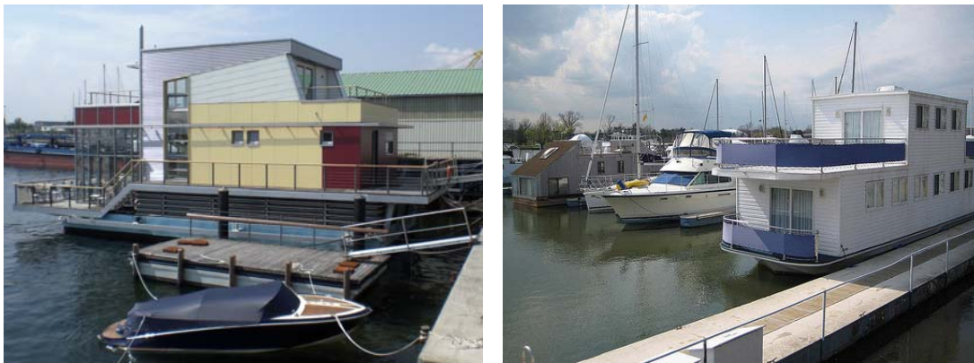
Abb. 6: Schwimmende Häuser in Sportboothäfen

Die Beantwortung der Frage nach den Möglichkeiten, Schwimmende Häuser in Sportboothäfen zu integrieren, erfordert weiterhin eine in zwei Richtungen gehende Untersuchung: die Voraussetzungen die ein Sportboothafen bietet, müssen genauso abgeklärt werden, wie die technisch/ökologisch/organisatorischen und formalen Bedingungen der Schwimmenden Häuser zu untersuchen sind. Erst der Abgleich dieser Untersuchungsergebnisse versetzt einen Betreiber/Investor oder eine Behörde in die Lage, sachgerecht zu einer Entscheidung zu kommen.