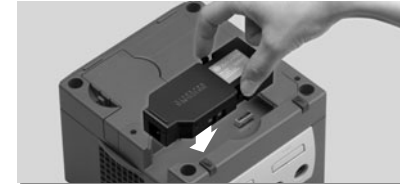
Dibujo 2 - Insertando el Broadband Adapter