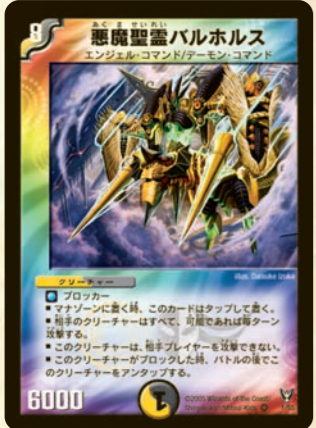
悪魔聖霊バルホルス 敵の行動選択の自由をうばうのが、この多色獣!! なんてたって相手獣を必ず攻撃させ、こいつはブロック後アンタップできるのだ。一瞬で相手獣を全滅させることができる!