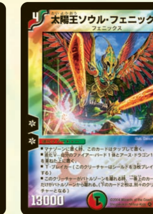
太陽王ソウル・フェニックス

進化元の種族全員をブロックされなくするデュアル進化獣。サイバードもヘドリアンも使えるヤツらが揃っているので、ぜひデッキに入れてたいクリーチャーだ。