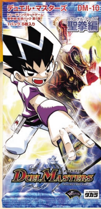
DM-10 聖拳編 拡張パック第1弾 ●メーカー希望小売価格:158円(税込) ●1パック5枚入り(ランダム/全120種)