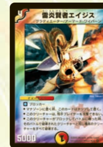
雷炎賢者エイジス ブロックして倒した種族を全滅させる!! 種族で固めているデッキ対策には有効だ!!