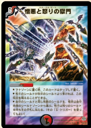
憎悪と怒りの獄門

究極の大逆転呪文!! 敵の橋が自分より多ければ、自分と同じ数まで減らせてしまうゾ! たえ相手の橋が10枚で、自分の橋が0枚でも簡単に逆転が可能になるのだ!