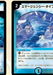
エマーゼンシー・タイフーン