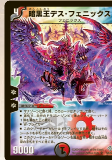
暗黒王デス・フェニックス

多色進化獣の登場!そして進化Vの「5大王」の誕生で新たな展開に入った聖拳編第3弾カードの紹介だ!!