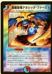
電磁旋電アサック・ファースト アンタップ敵獣を殴って、死んでも手札に戻るので、再生可能な除去呪文として使おう!