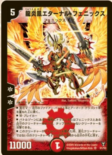
龍炎鳳エターナルフェニックス

多色カード、進化Vと、DMそのものを大きく変えた聖拳編の完成版!!「究極の王」や敵対文明色の融合など見逃せない!!