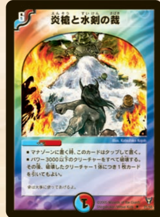
炎槍と水剣の裁 敵味方を問わず3000以下獣を一斉破壊!! そしてその後破壊した分カードを引いてしまう強力カードだ! 殿堂カードだから、デッキには1枚しか入れられないので注意!