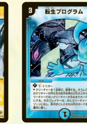
転生プログラム 場の1体を破壊し、代わりに山札から出すS・T!! 敵にも味方にも使えるので、いろいろ状況に合わせてくれるのがウレシイ。呪文デッキの敵に使っても面白いゾ!