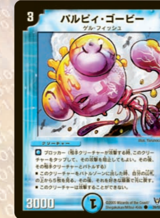
パルピィ・ゴビー ブロッカー(毎ターンクリチャーが破壊される時、このクリチャーをタップして、その効果を無効にしてもよい。その時、そのクリチャーをバトルゾーンに出す。このクリチャーをバトルゾーンに出した時、自分の呪文の上から任意で、その時、それ以外の文明色以外のカードを1枚、その時の手札に加え、このクリチャーを破壊することができる。