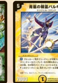
青嵐の精霊バルキア

敵の手札除去に対抗するならコイツがベスト!! 手札から墓地ではなく場に送るのだ!