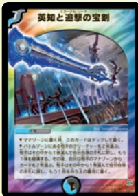
英知と追撃の宝剣

敵・味方の区別無しにクリーチャーを1体ずつ「いけいけ」にする、暴れん坊進化獣! もちろん自分もしっかり手札に戻せる効果のカードで対応しとくのだぞ!!