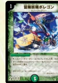
冒険妖精ポレゴン

場のクリーチャー1体を橋に変えてしまおう! 自分の守備固めも、敵のジャマ獣除去も可能!