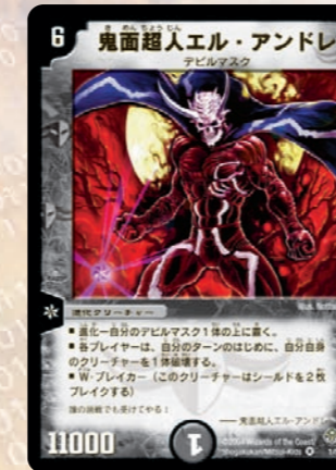
鬼面超人エル・アンドレ