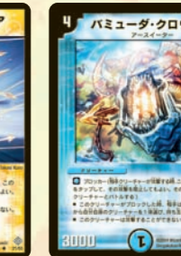
パミューダ・クロウラー

マナも重いがそれ以上にパワーが高いブロッカー。そこのクリーチャーじゃ倒せないぞ!!