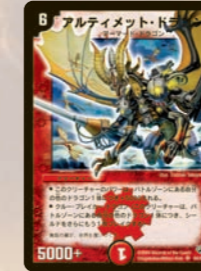
アルティメット・ドラゴン 場の味方龍1体につき、+5000され、さらに橋1枚を破壊! 優秀なA・ドラゴンだ。