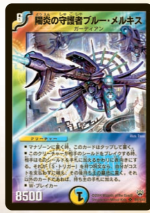
陽炎の守護者ブルー・メルキス 敵のS・T呪文を封じるならまだ分かるが、こいつは敵のS・T呪文が自分が使ってしまうってのがゴイ! 敵が橋にS・Tを仕込むほどウレシイぜ!