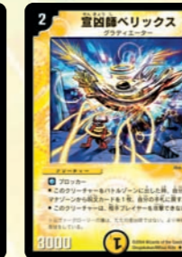
宣凶師ベリックス

進化元にもなる最速獣! 橋ブレイク後に手札に戻るのが気になる! だって1マナだ!