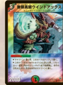
無頼勇騎ウインドアックス 対ブロッカー用に有効なクリチャー。しかもマナチャージまでできる。お得や。