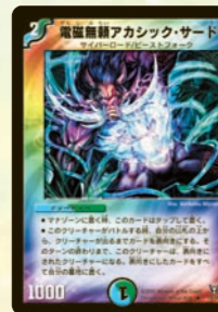
電磁無頼アサック・サード デュエルでも珍しい変身獣!! 戦闘時、山札をめくり、出た味方獣に変身しちゃおうのだ!!