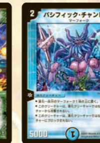
パシフィック・チャンピオン 進化獣以外には攻撃もブロックもされない2マナ進化獣!! 非進化デッキはイチコロか!?