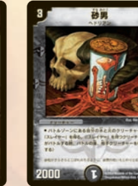
砂男 味方の火獣と水獣全員をスレイヤーに!! 多色カードでうまく3色デッキを作ろう。