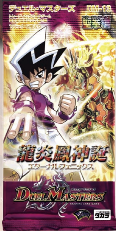
DM-13 聖拳編 拡張パック第4弾 ●メーカー希望小売価格:158円(税込) ●1パック5枚入り(ランダム/全60種)