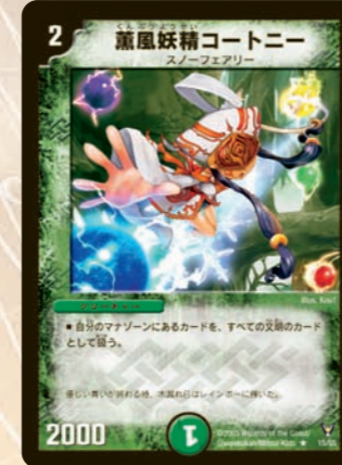
薫風妖精コートニー 自分のマナをすべての文明色にしてくれる山札操作ができるブロッカー。登場時に山札5枚の順番を操作できるので、欲しいカードを山札の1枚上に持つてこよう! 他のカードとの相性も良い!! ご利用は計画的に!?