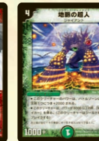
地脈の超人 場の文明の数だけ強くなる!! 多色カードデッキなら、楽勝で4マナのWB獣になる。