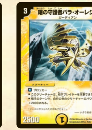
曙の守護者パラ・オーレシス 相手のターン中、他の味方獣全員をパワーアップさせてくれる応援団長がこのパラ・オーレシスだ。自分の小パワー獣も反撃を恐れずに攻撃できるゾ!!