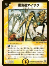
肅清者アイザク ブロックの後に、味方1体をアンタップ! コイツ自身を溜め、何度も起さあがって、ガコを完封できる!