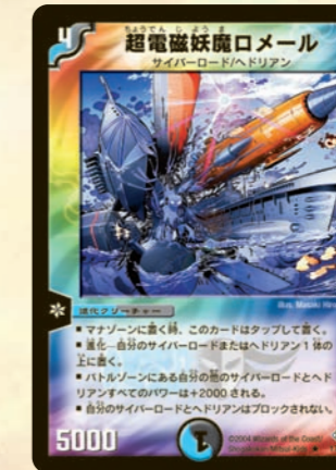
超電磁妖魔ロメール

「デュエル・マスターズは手札が命」という言葉があるくらい、D・Mでは手札の枚数は大事。こいつは殴るたびに敵の手札を捨てさせるので、相手の戦略を台無しに。