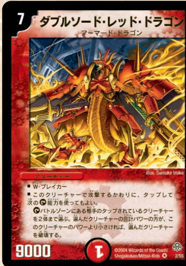
ダブルソード・レッド・ドラゴン

未だその強力が語り継がれているWSや多色呪文が誕生した聖拳編第2弾。その中でもオススメカードはこいつらだ!!