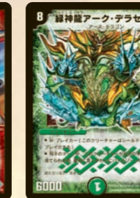
緑神龍アーク・テラセルナ

パワー5000で、橋も攻撃できるスピードアタッカー! 攻撃後手札に戻らないのでお得!