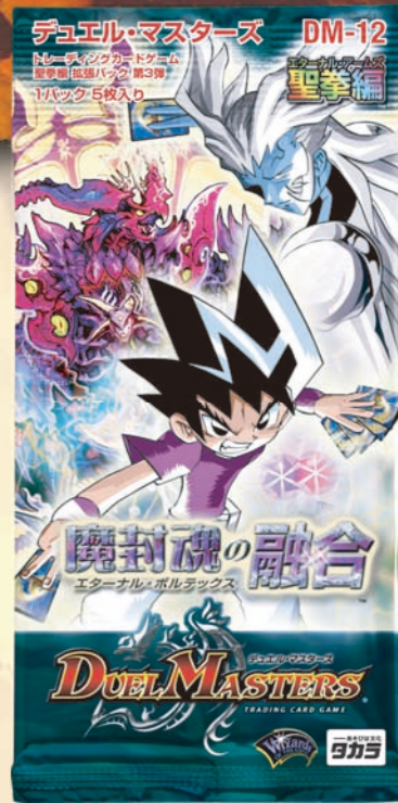
DM-12 聖拳編 拡張パック第3弾 ●メーカー希望小売価格: 158円(税込) ●1パック5枚入りランダム/全60種