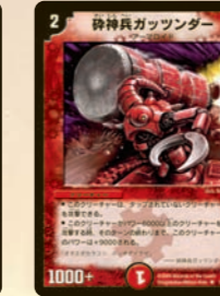
碎神兵ガッツンダー 速攻獣でありながらも、切り札級のデカブツに対しては、パワー10000でぶつかるゾ!