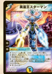
英霊王スターマン

破壊されても、よそへ移動になっても、進化元を2枚とも場に残すことができるのが、この太陽王。手札にもう1枚こいつがあれば、すくまた進化できてしまう! たった4マナ。