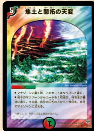
焦土と開拓の天変

究極の大逆転呪文!! 敵の橋が自分より多ければ、自分と同じ数まで減らせてしまうゾ! たえ相手の橋が10枚で、自分の橋が0枚でも簡単に逆転が可能になるのだ!