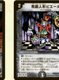
死劇人形ビエール たった2マナのスレイヤー・ブロッカー!! 必ずブロックしなければならぬ強力だ。