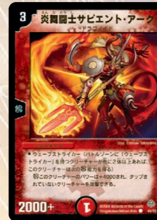
炎舞闘士サビエント・アーク

相手のマナを減らし、自分はマナ加速ができてしまう呪文。デュエル・マスターズは先に切り札獣を出せるマナを貯めた方がかなり有利になるので、相手に差をつけろ!!