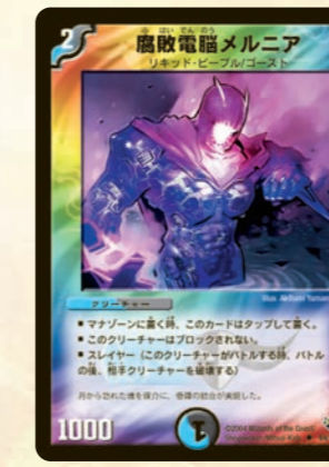
腐敗電腦メルニア たった2マナのスレイヤー。しかもブロックされないで、どんな強力ブロッカーも恐くないのだ。破壊される時は、敵の切り札獣と道連れだ!