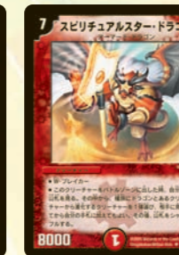
スピリチュアルスタードラゴン ココロコ陸上の龍コンテストから生まれた血統書付カード!! 進化龍と相性バッチリだ!!