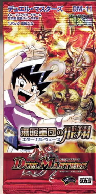
DM-11 聖拳編 拡張パック第2弾 ●メーカー希望小売価格: 158円(税込) ●1パック5枚入り(ランダム/全60種)