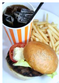
【ハンバーガーセット】