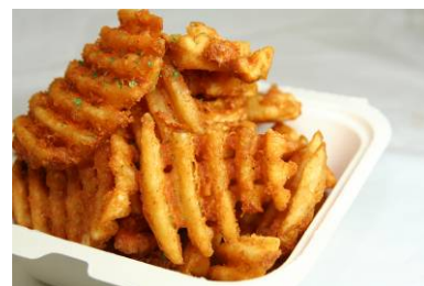
【ガーリックフライドポテト】