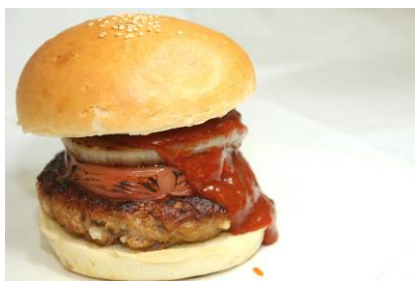
【ライオンズバーガー】