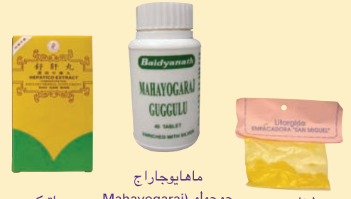
هيباتيكو إكستراكت (Hepatico Extract)