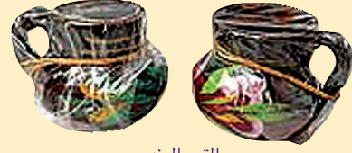
التمر الهندي (Tamarind)