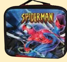
লাঞ্চ বক্স (Lunch box)