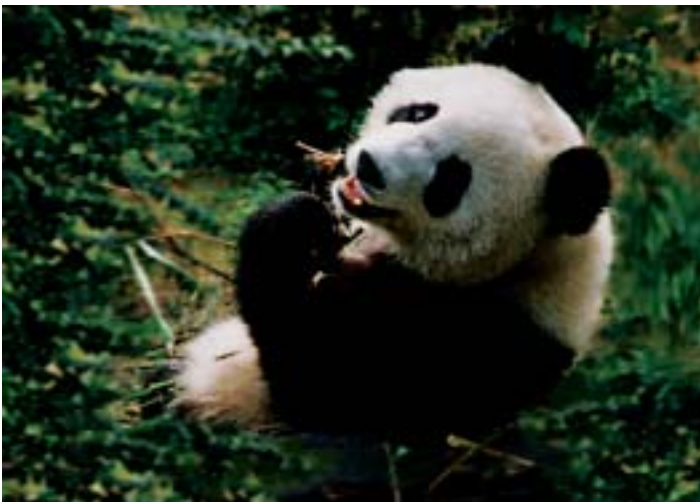
大熊猫是白马藏族人的邻居

路东线纵贯全境，是出入九寨、黄龙风景区的最佳通道和门户，同时又是国家级剑门蜀道风景区的重要组成部分，有我国目前保存最为完好的明代宫殿式佛教寺院建筑群——报恩寺、三国历史遗迹蜀汉江油关、白马后裔风情、王朗自然保护区、涪江龙门峡、龙门山森林公园等众多自然和人文景观。景区内