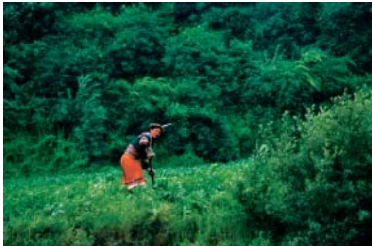
在田间劳作的白马藏族妇女

要给他们寄去，千万别忘了。我能忘记吗？这是我惟一能为他们做的事情。时至今日，那老人的祝福、小孩的天