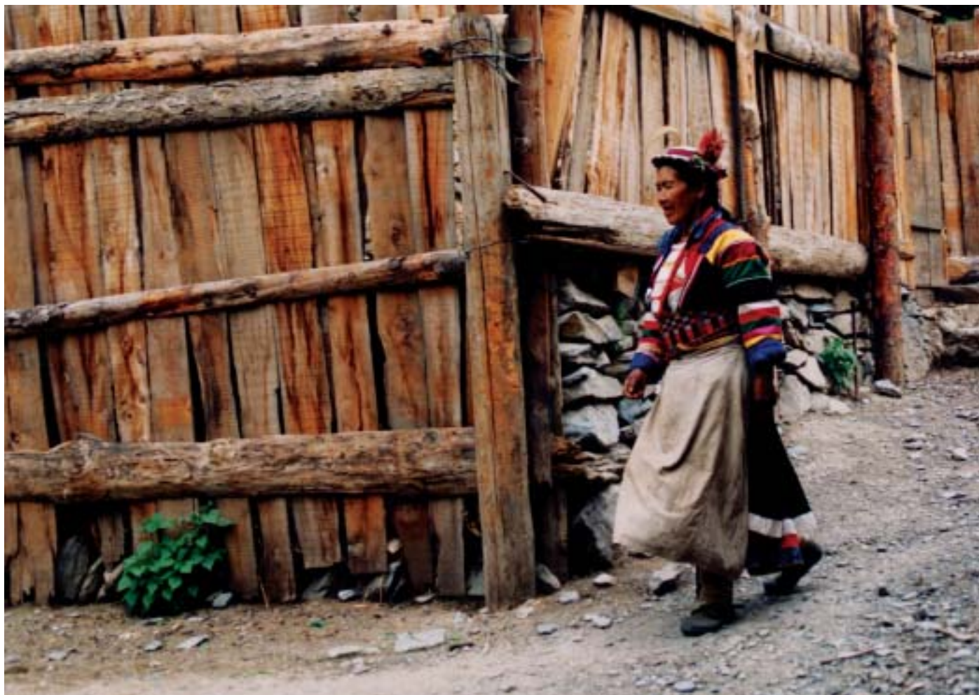
白马藏人过去一直以宗族为单位居住在一起，形成连片的村寨。住宅一般为3层，下层圈畜，中层住人，上层贮物

很好。出县城不久便进入崇山峻岭的峡谷之中。这是一个绿色的世界，植被保存完好，潺潺的涪江水清澈见底，清新的空气让我们这些城里人贪婪地大口呼吸，后悔不该在昨天浪费胶卷，昨天的景色固然美，但怎能与今天比？连大熊猫、金丝猴都把这里选作家园，可见白马藏人崇尚的生活境界是何等的舒适悠然。