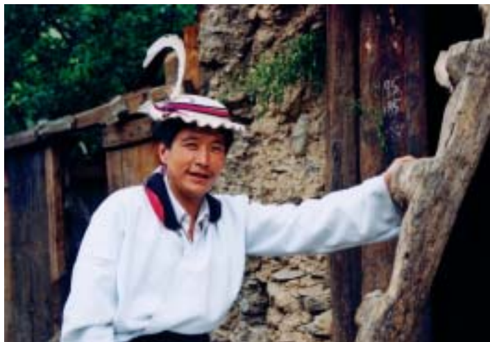
白马藏人男装一般为白色和青色右开襟长衫，腰系长方形铜牌皮带。小伙子们都有上下独木梯的高超本领

要给他们寄去，千万别忘了。我能忘记吗？这是我惟一能为他们做的事情。时至今日，那老人的祝福、小孩的天