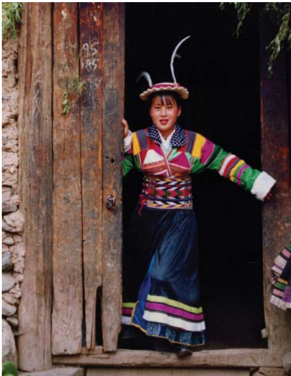
白马藏人穿自织本色麻布配以彩色边幅长衫，女装胸戴鱼骨片，胸、肩、袖均加以彩色布条缝成格状作装饰。后摆为百褶裙，腰系自制彩色宽带并配以铜钱

几位姑娘的着装与我们汉族服装并没有区别。不知何时又来了几位小伙子，我们说明来意后，他们马上放下手中的活儿，热情邀我们到寨子去。我被他们的爽快、耿直和热情深深的打动了。