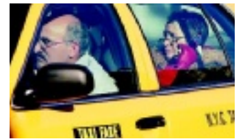
Ett av New Yorks signum.

21, 7th Avenue South lukeandleroy.com Bar med dansgolv på andra våningen där dj-stjärnor gästspelar. Lockar ung svart publik (torsdagar är gay). Här dök Madonna upp, dj:ade och intog dansgolvet en lördagskväll.