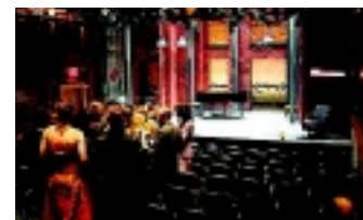
Cherry Lane Theatre.

30 Gansevoort Street charlesnolan.com Livsstilsboutique med både festblåsor och krimskrams. Som att komma in i ett kreativt hem i Meatpacking District, där butiken verkligen hör hemma på västra sidan om Hudson Street.