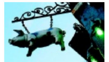
The Spotted Pig.

314 West 11th Street Chockade krogvärlden med att som första pub få Michelin-stjärna. Engelskt Villagemys med hög trendfaktor. Minst lika engelska Shag ett par kvarter bort på Abingdon Square är bar-alternativet.