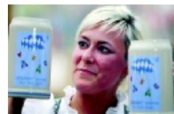
Årets officiella Oktoberfest-sejdel. Festen började i går och pågår till den 3 oktober.