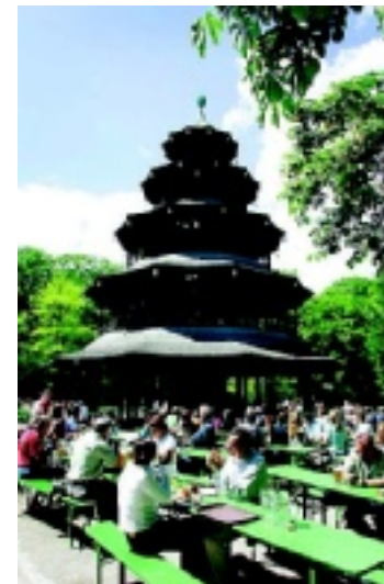
Ett av Münchens populäraste öl-ställen ligger bredvid Chinesischer Turm.