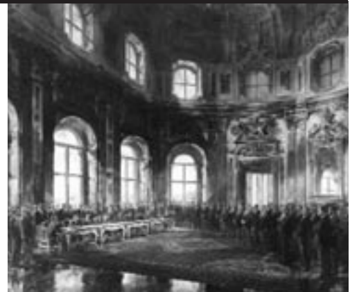
„Die Unterzeichnung des österreichischen Staatsvertrages im Oberen Belvedere 1955“ – Gemälde von Robert Fuchs, Kunstdruck der österreichischen Staatsdruckerei, Wien