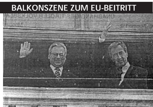
Die beiden ÖVP-Politiker Erhard Busek und Alois Mock nutzen 1994 den Nimbus der historischen Örtlichkeit um für ein Ja der ÖsterreicherInnen zum EU-Beitritt zu werben.