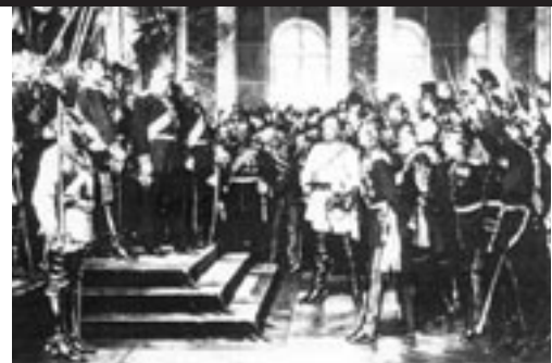
Anton von Werner: Die Proklamierung des Deutschen Kaiserreiches 1871 im Spiegelsaal von Versailles. 3. Fassung 1885.

Warum machte das dritte Bild „Karriere“ und blieb das erste ein Gemälde ohne Nachhall? Die erste Fassung – der historischen Situation offensichtlich näher – zollt