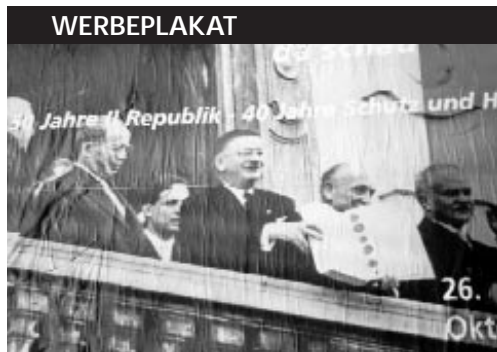
Werbeplakat des Österreichischen Bundesheeres, das die Erinnerung an den Staatsvertrag (und die darin enthaltene Verpflichtung zur Selbstverteidigung Österreichs) für das eigene Image nutzt.