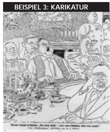
Karikatur von H. E. Köhler zu den Verhandlungen der österreichischen Delegation in Moskau im „Simplicissimus“, Jg. 1955, Nr. 17, S. 3. Bildunterschrift: Weaner Charme in Moskau: „Und jetzt, Raab – jetzt noch d’Reblaus, dann sans waach!“

Die Karikatur weist Österreich – trotz der verhaltenen Ironie der Botschaft – gleichsam seine Rolle als kleiner, aber durch die verfügbare Intelligenz, Bildung und Kultur seiner BürgerInnen wichtiger Staat in Europa zu. Die Karikatur löste und löst noch immer in den BetrachterInnen – so sie österreichischer Herkunft – angenehme, weil positive Assoziationen aus. Die Beförderung des Selbstwertgefühls wird durch keine die Vergangenheit betreffende negative Konnotation beeinträchtigt.