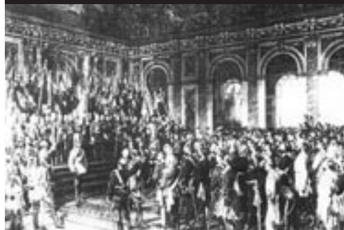
Anton von Werner: Die Proklamierung des Deutschen Kaiserreiches 1871 im Spiegelsaal von Versailles. 1. Fassung („Schlossfassung“ 1877).