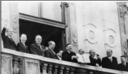
Nach der Unterzeichnung des Staatsvertrages am Balkon des Schloss Belvedere. V. l. McMillan (GB), 3. v. l. Dulles (USA) Pinay (FR), Figl, Schärf, Molotow (UdSSR), Raab.

Die Zahl der Akteure ist überschaubar, ihre Physiognomie ist gut erkennbar und spiegelt die Bedeutung und die Zufriedenheit über das Vereinbarte wider. Die Personen strahlen Autorität aus, nicht nur durch die konnotativen Effekte des an alte Tradition gemahnenden Balkons und der dem Anlass entsprechenden Kleidung, sondern durch die Kameraperspektive von schräg unten, die die Personen, insbesondere den im genauen Mittelpunkt des Bildes stehenden Leopold Figl, perspektivisch überhöhen. Die Haltung und die Physiognomie Figls beim Vorzeigen des Vertrages mit den Siegeln und Unterschriften der Signatarmächte hat einen unübersehbar listig-triumphierenden, dynamischen Charakter, der bei den (österreichischen) BetrachterInnen wohl angenehme Gefühle auszulösen imstande war und ist: Signalisierte die Geste doch eine aktive Neupositionierung Österreichs in der Staatengemeinschaft und dokumentierte die dargestellte Szene gleichsam das neue Selbstbewusstsein des kleinen Staates Österreich.